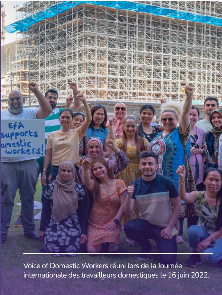
Voice of Domestic Workers réuni lors de la Journée internationale des travailleurs domestiques le 16 juin 2022.