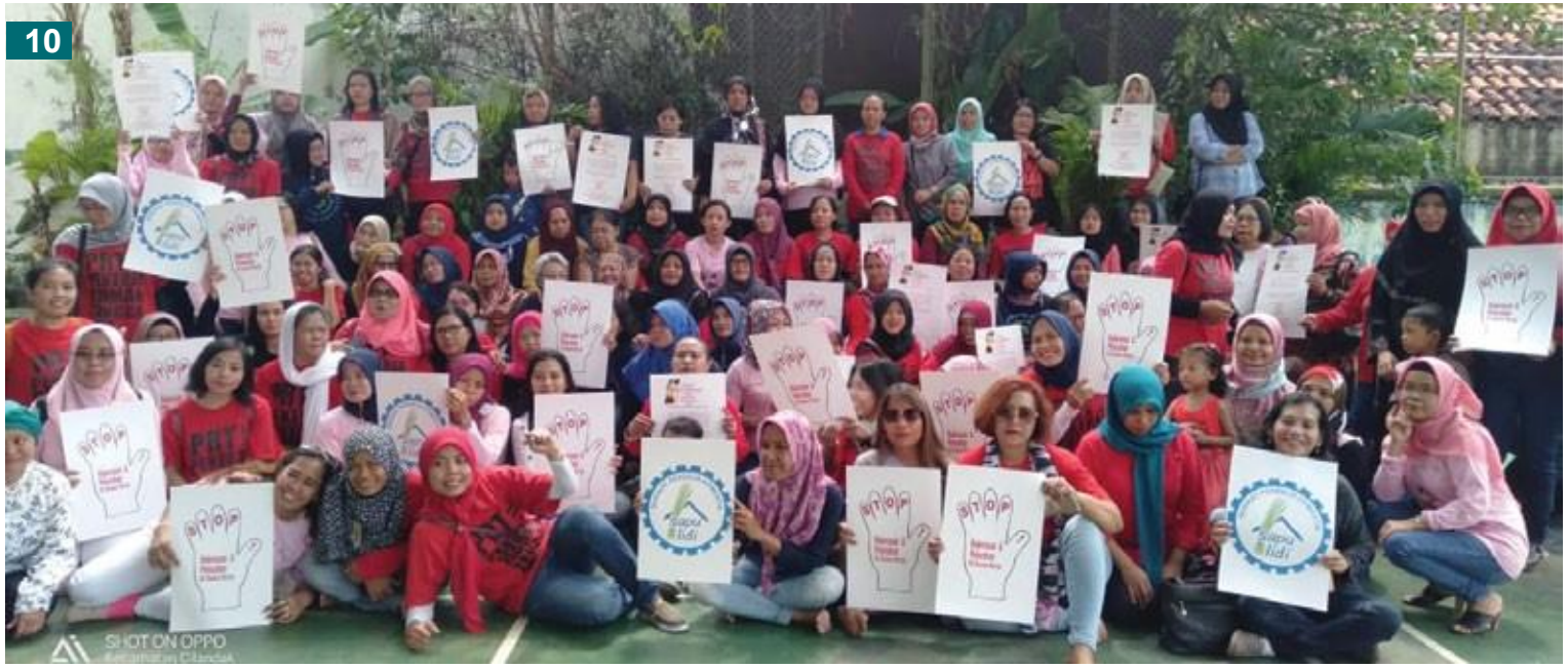
பிலம் : JALA PRT

2019 இன் முற்பகுதியில், ஆசியாவில் வீட்டுப் பணியாளர்கள் எதிர்கொள்ளும் பால்நிலை அடிப்படையிலான வன்முறை மற்றும் துன்புறுத்துதலின் புலனாதல் தன்மையை அதிகரிப்பதற்கும் மற்றும் அத்தகைய வன்முறையில் பாதிக்கப்பட்டவர்களுக்கு எவ்வாறு வீட்டுப் பணியாளர்கள் ஸ்தாபனம் (DWO) உதவின என்பதைப் பகிர்ந்து கொள்வதற்குமாக வீட்டுப் பணியாளர்களுக்கு எதிரான வன்முறை தொடர்பாக ஒரு சம்பவக் கதையை விபரிப்பதற்கு IDWF அதன் DWO இணைப்புகளை அழைத்தது. உடல் ரீதியான வன்முறை மற்றும் துன்புறுத்துதலின் பரிமாணத்தை சேர்த்துக் கொள்வதற்காக குவைத்திலுள்ள சன்டிகன் வீட்டுப் பணியாளர்கள் சங்கத்திலிருந்து ஒரு சம்பவம் உட்பட, இந்த சம்பவத் தொகுப்பில் எட்டு சம்பவங்கள் விபரிக்கப்பட்டுள்ளன. IDWF இந்த சம்பவங்களின் கதைகளை பின்வரும் ஒரு நோக்கத்திற்காகத் தொகுத்தது: