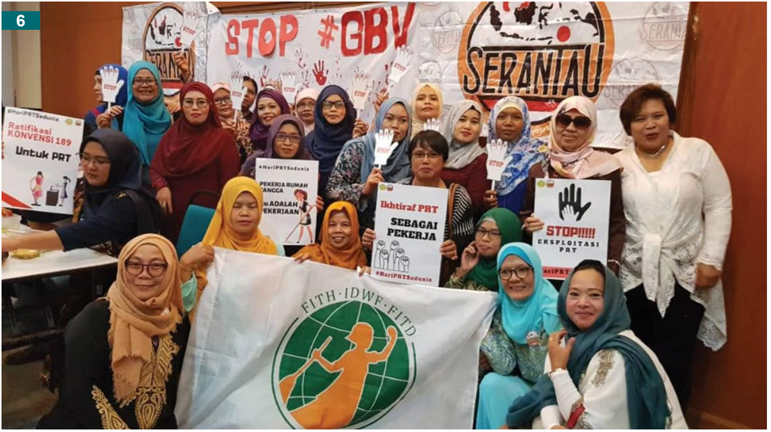
புலம்பெயர் வீட்டுப் பணியாளர்கள் வீட்டுப் பணியாளர்களுக்கான சர்வதேச தினத்தைக் கொண்டாடுகின்றனர், மலேஷியா:2019-6-16