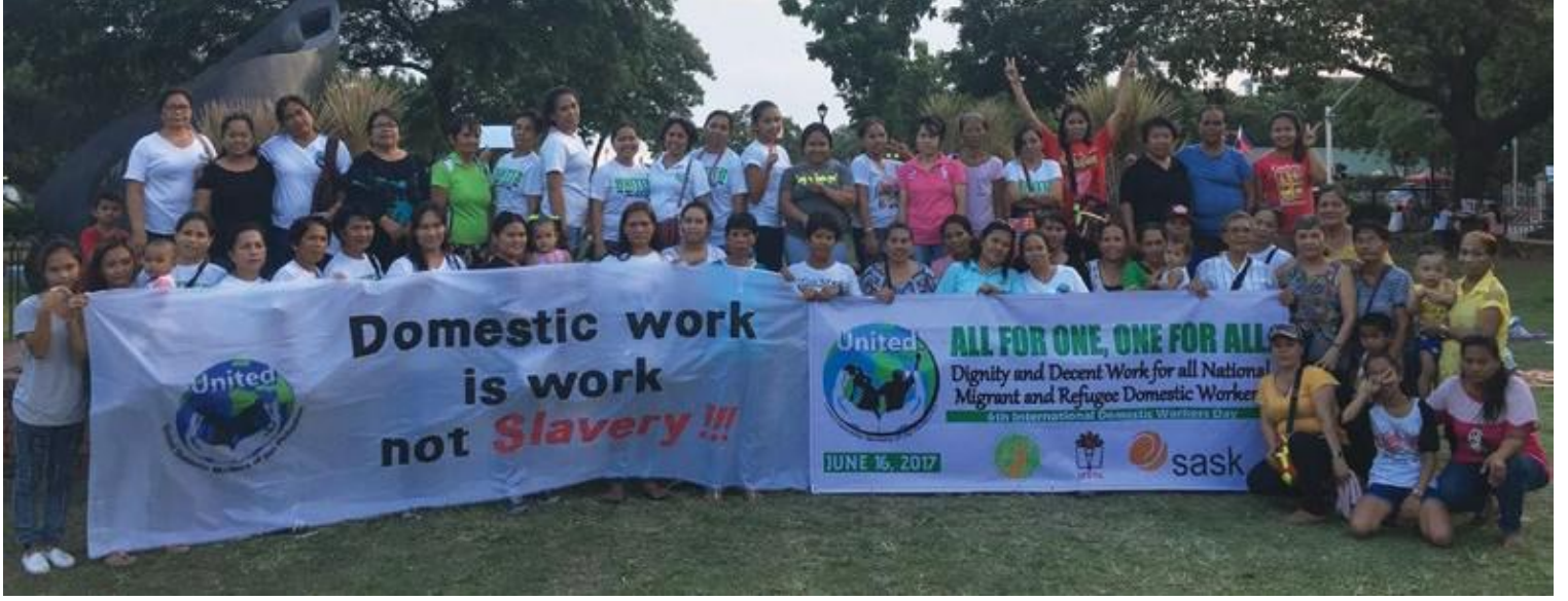
பிலிப்பைன்ஸ்: வீட்டுப் பணியாளர்களுக்கான சுற்றுலா வகை நிகழ்ச்சித்திட்டம், UNITED

பிலிப்பைன்ஸின் ஐக்கிய வீட்டுப் பணியாளர்கள் (UNITED)