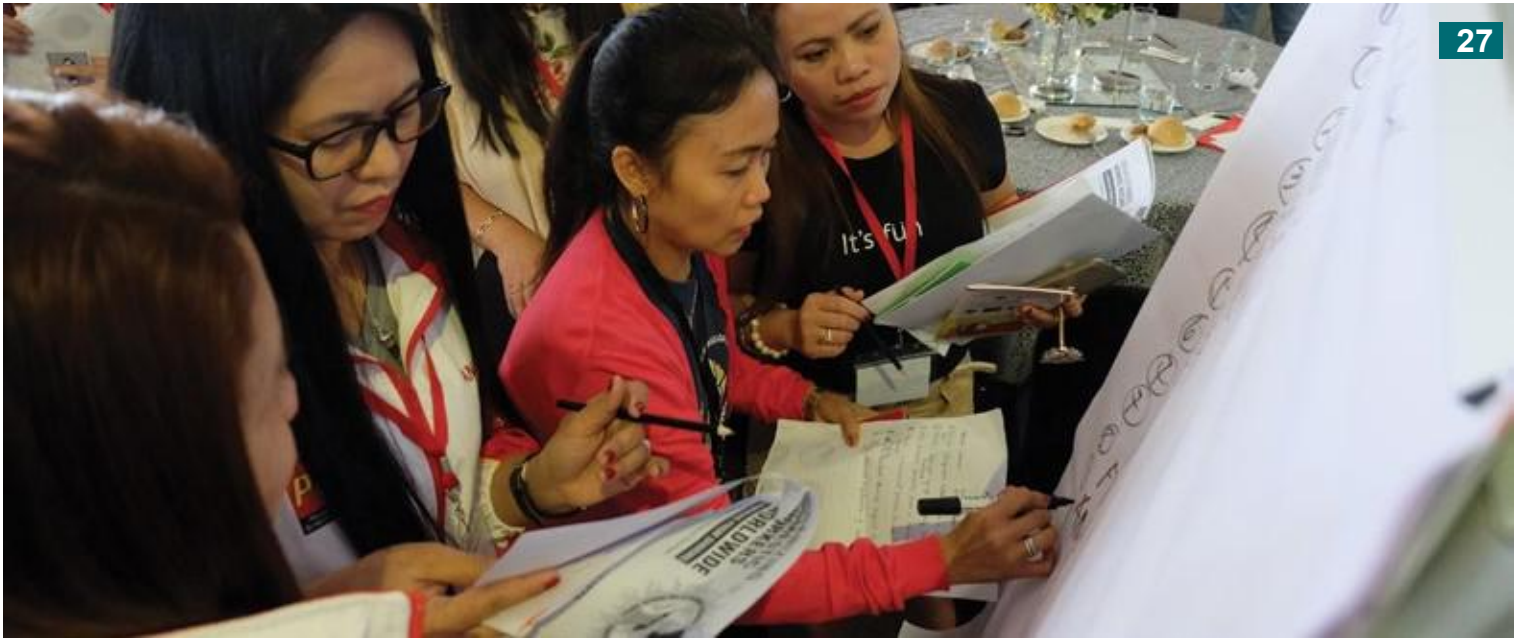
டிசம்பர் 2019 இலான ஒரு மாநாட்டில் வெவ்வேறு இடங்களிலிருந்து வந்த பிலிப்பைனோ புலம்பெயர் வீட்டுப் பணியாளர் தலைவர்கள்.