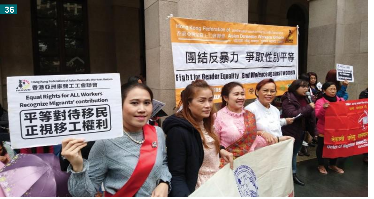
FADWU ஊர்வல அணி, ஹொங்கொங்